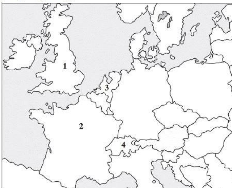
Fragment mapy politycznej Europy