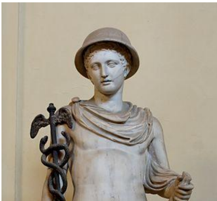
Hermes noszący petasos oraz podróżną pelerynę.

Asterix również nosił tę część garderoby