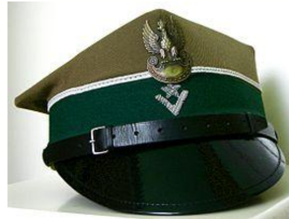
✓ Rogatywka – czapka wojskowa