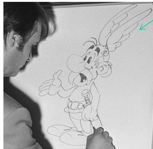
Albert Uderzo drawing Astérix, in 1971,