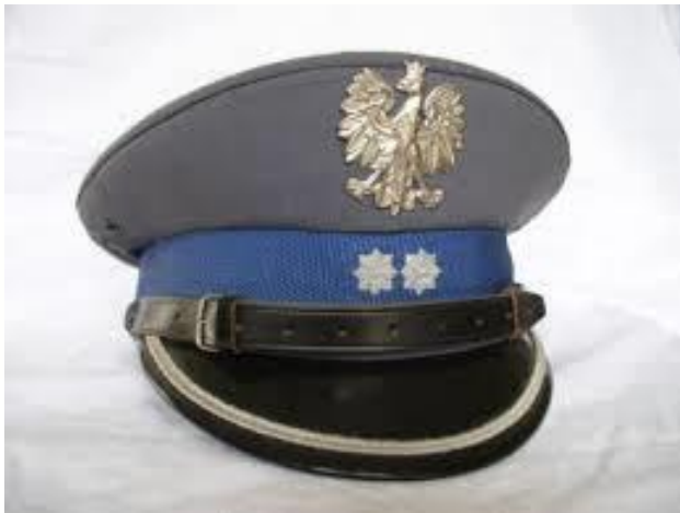
✓ Czapka policyjna