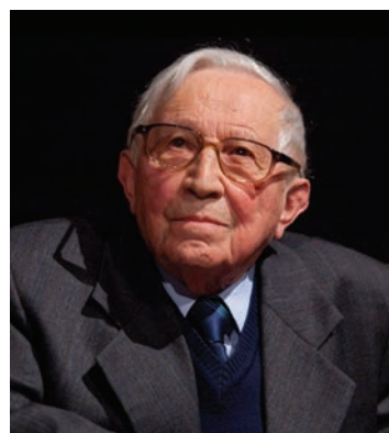
Tadeusz Różewicz. Łódź, 4.10.2010 r.

1. Kreacja podmiotu lirycznego (pytania pomocnicze: Kim jest podmiot liryczny?, O czym snuje rozważania?, Czy można określić jego stosunek do „kwestii Boga”? ):